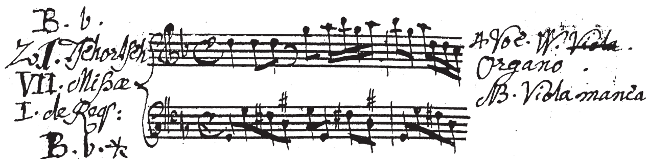
Abb. 3: Stamser Musikalienkatalog von 1791, S. 158, Nr. 21: Eintrag J. G. Tschortsch, "VII Mißae/I de Req." op.2 (Musikarchiv Stift Stams)