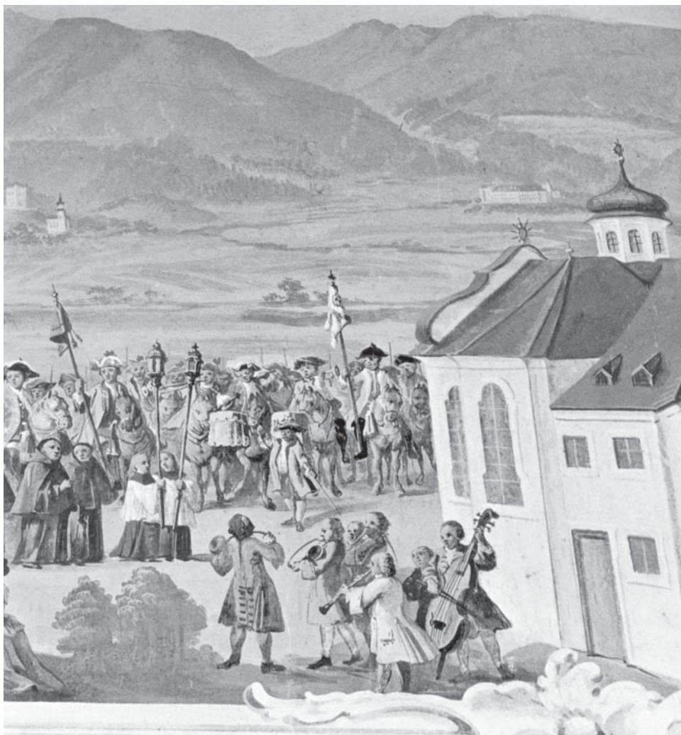
Votivfresko der Einweihung der Hl. Kreuzkirche bei Pill von Christoph Anton Mayr 1767. Ausschnitt: vorne die Pfarrmusik, dahinter die Pauker und Trompeter der berittenen Sakramentsgarde von Schwaz.