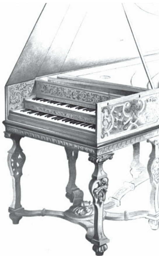
Cembalo mit zwei Manualen, von dem berühmten Cembalobauer Jan Couchet, Antwerpen, 1650 (Metropolitan Museum of Art)