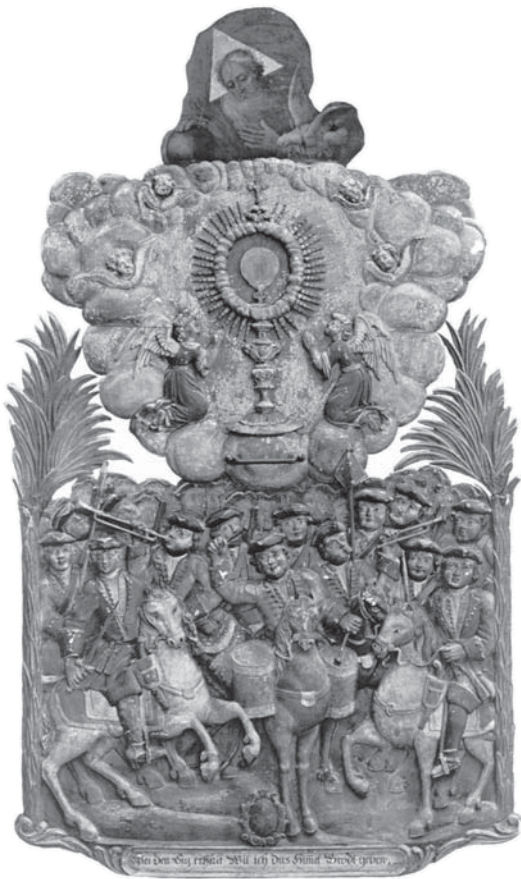
Die Tafel der berittenen Sakramentsgarde (Corpus Christi Bruderschaft) in Schwaz, um 1700. Die Musik besteht aus einem Pauker und zwei Trompetern. Tafelbild aus der Pfarrkirche Schwaz.