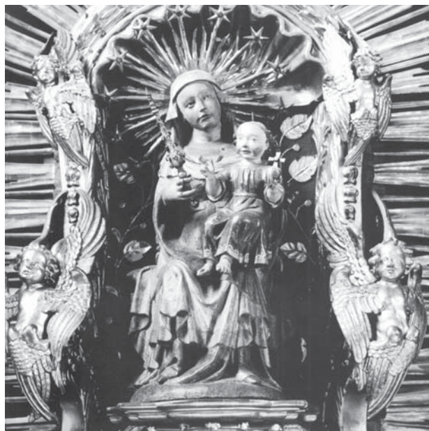
Tschortsch war ein großer Muttergottes-Verehrer. Unsere Abbildung: Maria mit Kind, um 1410, am Firmiansaltar der Schwazer Pfarrkirche.