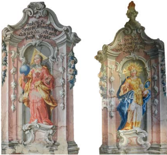
Personifikation der allmächtigen Liebe, C. A. Mayr, um 1760 (links) und Personifikation der göttlichen Weisheit, C. A. Mayr, um 1760 (rechts)

Zwei weitere, vermutlich ebenfalls von einem Heiligen Grab stammende, hochrechteckige, karniesbogenförmig abgeschlossene Leinwandbilder weisen eine ähnliche gemalte Rahmung wie die beiden Passions-szenen auf und zeigen Personifikationen der göttlichen Tugenden. Die Bilder werden indirekt durch die Inschriften erklärt, während die Attribute in diesem Sinne mehrdeutig verstanden werden können. 17 Die beiden androgyn anmutenden allegorischen Gestalten sind optisch vor eine flache Rundbogennische gestellt und zeichnen sich durch eine leichte Drehbewegung und einen gekonnten Einsatz von Spiel- und Standbein aus. Die Personifikation der göttlichen Weisheit (im Bogenfeld bezeichnet „Der Voller Weiß- und Heiligkeit / wolt Leiden und vill / Bütterkeit.“) trägt ein bodenlanges hellgelbes Untergewand, einen ockerfarbenen Brustharnisch mit angesetztem kurzem Rock und einen effektvoll drapierten blauen Mantel.