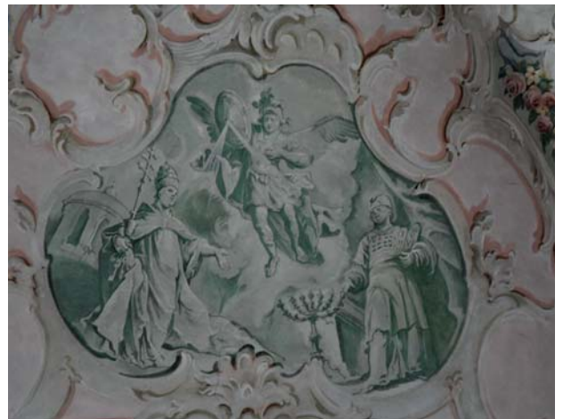
Kartusche mit Darstellung des Erzengels Michael als Fürst des Alten und Neuen Bundes zwischen Papst und Hohepriester

Propheten Josua dargestellt, auf der Südseite erscheint Michael als Reiter einer Gruppe von Soldaten. In der folgenden Kartusche im Westen schwebt der Erzengel als Fürst des Alten und des Neuen Bundes zwischen einem Papst und einem Hohepriester, gegenüber erscheint er als Seelenwäger beim Jüngsten Gericht. In der Zwickelkartusche auf der Nordseite wird der Streit um den Leichnam des Moses geschildert, während gegenüber Daniel in der Löwengrube auftritt. Die Stichkappe über dem Chorfenster an der Nordseite zeigt das Wunder am Monte Gargano und gehört inhaltlich mit der gegenüberliegenden Szene zusammen, die den Erzengel vor dem Bischof von Sipont zeigt. 15