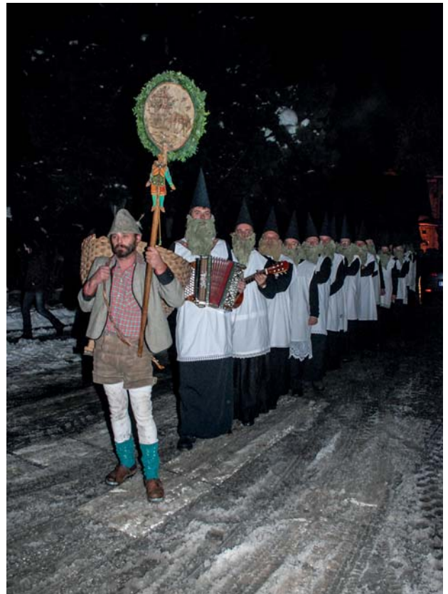
Angeführt vom „Urbal“ ziehen die Anklöpfler durch Stans.

Dem Kirchgeahn tema nix achten, dem Beicht'n semas ganz Feind, denn's Gwiss'n erforsch'n macht tracht'n, weil der Beichvota olaweil greint (schimpft).