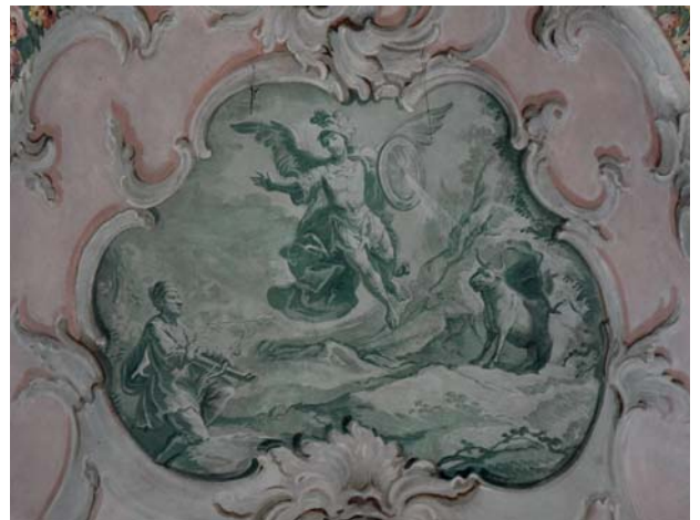
Kartusche mit Darstellung des Wunders vom Monte Gargano