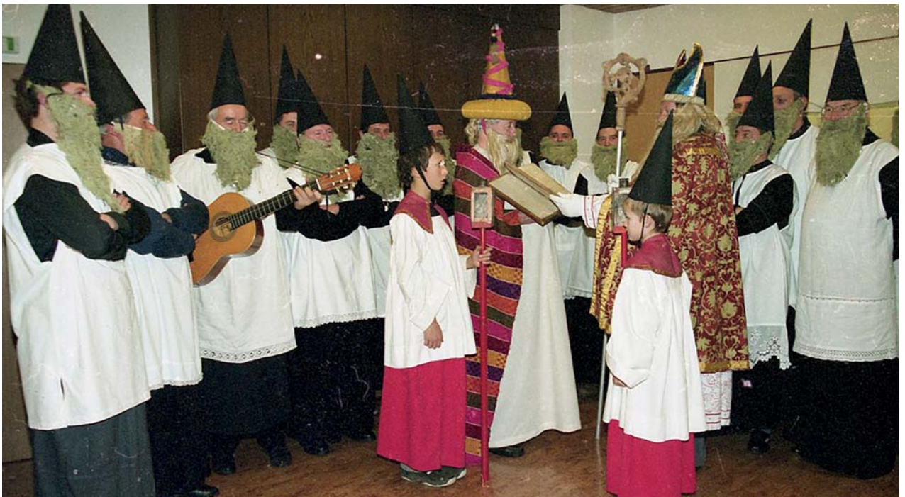
Die Staner Anklöpfler bei einem Auftritt im Jahre 2000