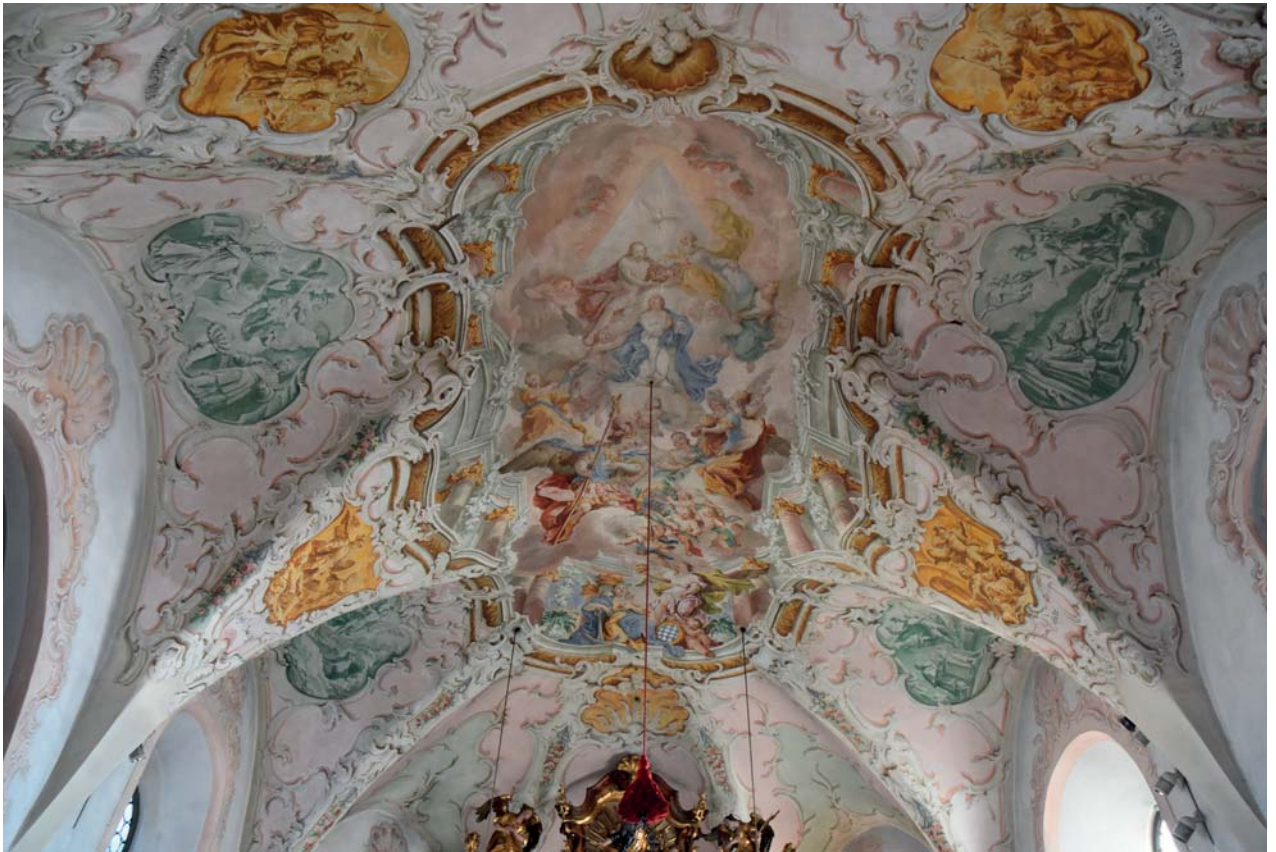
Pfarrkirche Gaißach, Deckenfresko im Chor von Christoph Anton Mayr

entstandene Langhausfresko mit der Marienkrönung in Schongau auf ... , das in ähnlicher Weise illusionistische Architekturräumung und Großfiguren um die entrückte himmlische Szene anordnet und Farbe und Lichtführung für die Höhenillusion vergleichbar einsetzt. 42 Auch im Dehio-Handbuch 3 wird kein Künstler genannt, sondern lediglich auf das Langhausfresko in der Pfarrkirche von Schongau (deren Deckenfresken von Matthäus Günther stammen) verwiesen.