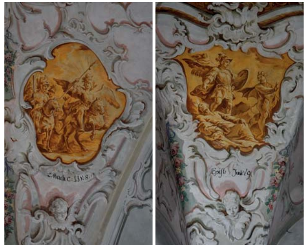
Zwickelbild mit Abbildung des hl. Michael mit Reitern (links) und Zwickelbild mit szenischer Darstellung des Streites um den Leichnam des Moses (rechts)

Das annähernd längsovale Deckenfresko ist mit einem kräftigen, passig geschwungenen gemalten Rahmen versehen, während die szenischen Darstellungen in den Stichkappen- und Stichkappenzwickeln von Rocaillekartuschen in der Tradition des „Stucco finto“ gerahmt werden. Als Auftraggeber des Deckenfreskos wird aufgrund des Rautenwappens und des Kurfürstenhutes der allegorischen Gestalt am unteren Bildrand der Wittelsbacher Hof bzw. der Kurfürst Max III. Joseph angenommen. Denkbar wäre auch ein Einfluss der 1693 in München gegründeten St. Michaels-Bruderschaft, die seit 1729 auch in Bad Tölz aktiv war und später auch in Gaißbach nachweisbar ist. 12