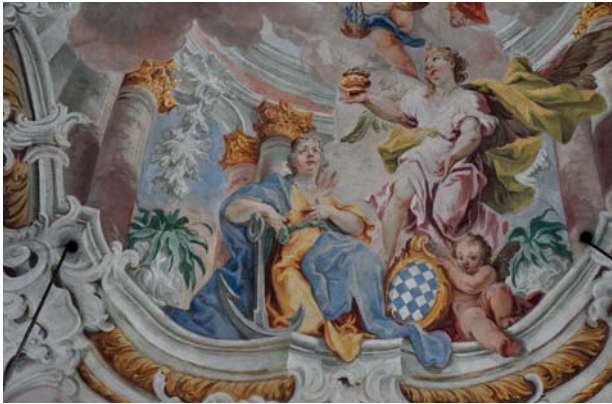
Pfarrkirche Gaißach, Detail aus dem Chorfresko mit allegorischer Figur der Bavaria

gefaltet. Vier Engel assistieren der Krönung, einer von ihnen unterstützt den Kreuzbalken und hält ein Apothekergefäß als Hinweis auf das Wirken des Engelschores für die Heilung der Kranken. Im räumlich vortretenden mittleren Bereich des Bildfeldes tritt der Kirchenpatron und Erzengel Michael im fürbittenden Gestus in Erscheinung, der einen blauen Brustharnisch mit gelbem kurzem Rock und einen roten Mantel trägt und von einer Engelsschar begleitet wird, die seine charakteristischen Attribute, eine Waagschale und ein Flammenschwert, halten. Ihm gegenüber finden sich drei grün bzw. ockerfarben gewandete Engel mit Kaiserkrone, Kurhut und Helm, die durch ihre Attribute als Vertreter der Engelschöre charakterisiert werden.