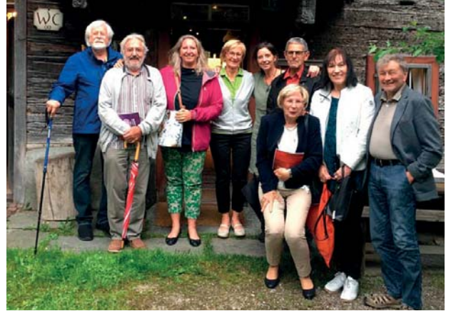
Freundschaftsbesuch im Museum Rablhaus am Weerberg am 9. Juni 2021