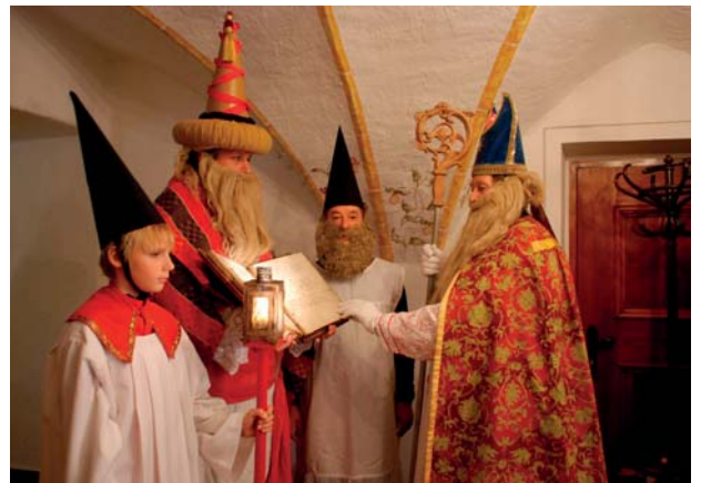
2010 entstand diese Aufnahme mit dem Hohenpriester und dem Bacchus.

Der Hohe Priester ist es auch, der das eigentümliche Singspiel eröffnet. Dieses umfasst zwölf vierzeilige Strophen, an welche das „Bettlerlied“ anschließt. Die